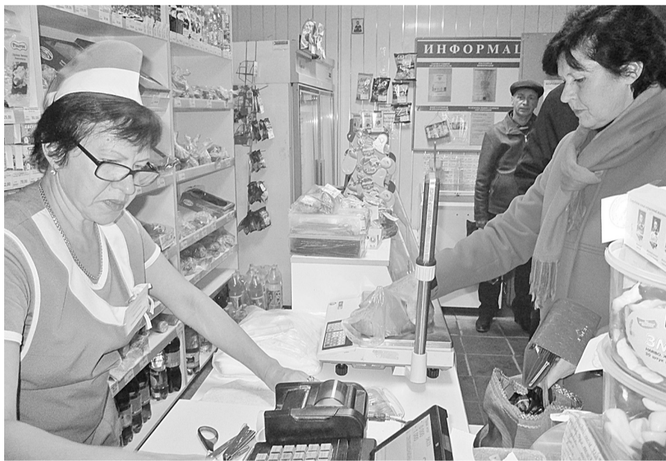
В магазине на проходной завода растёт поток покупателей